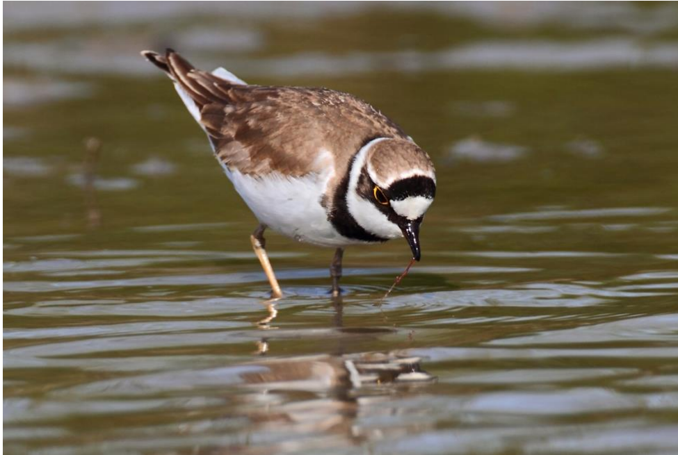
Kleine Plevier met rode muggenlarve / Koos Dansen

Sinds 1975 worden er tellingen gehouden in het Landje van Gruijters. De laatste jaren zijn de tellers wekelijks op stap. Er worden drie telgebieden onderscheiden: Landje van Gruijters, IJsbahn en de fortgracht en omgeving. Dit levert een grote set aan gegevens op waarmee allerlei analyses gedaan kunnen worden. Interessant is altijd het maximaal aantal aanwezige vogels van een soort. In de tabel staat het maximum aantal aanwezige vogels in de drie telgebieden samen. De cijfers van de wekelijkse tellingen is aangevuld met cijfers ontleend aan de website waarneming.nl. Met dank aan alle tellers en coördinator Annemiek Huneker.