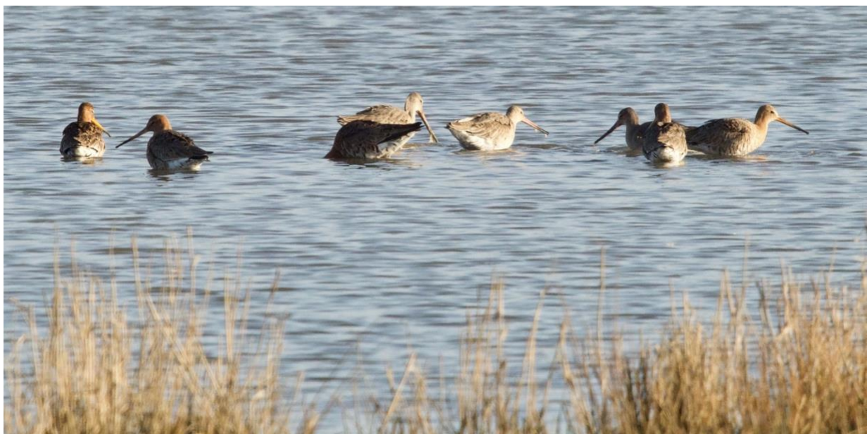
Grutto's / Ton Lansdaal

Op waarneming.nl ingevoerde soorten van de meest herkenbare soortgroepen in het Landje van Gruijters. De onderste rij is het totaal aantal soorten. Dit is exclusief hybriden, varianten en ondersoorten.