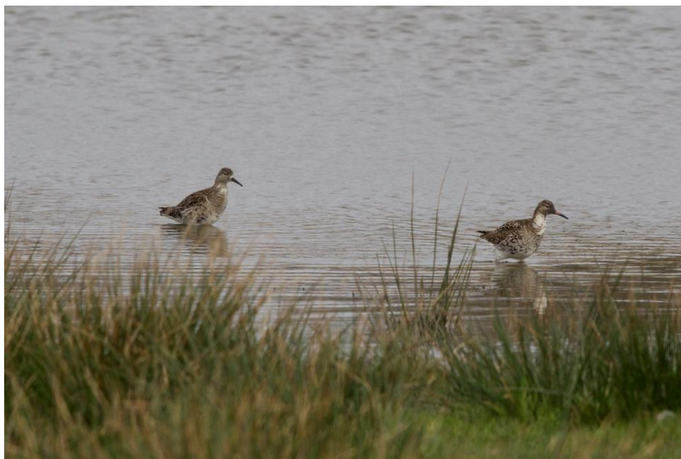
Kemphanen / Ton Lansdaal