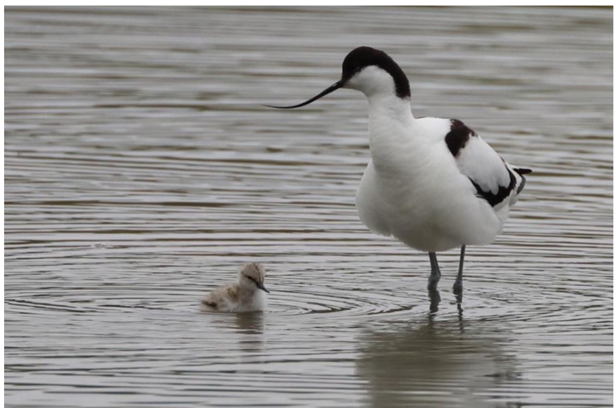
Kluut met jong / Ton Haver

Bij veel andere soorten zijn de aantallen opvallend constant.